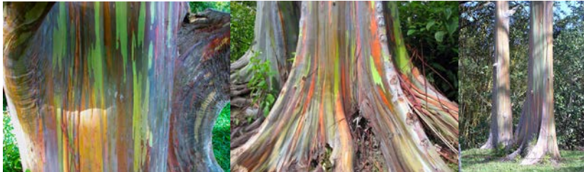
Die Vielfalt von Mehrsprachigkeit: Regenbogen-Eukalyptus