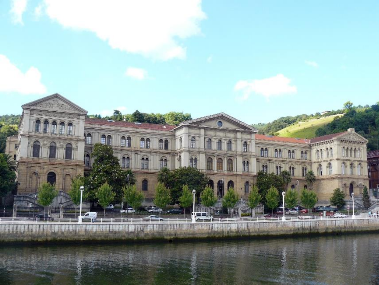
Universidad de Deusto, Bilbao