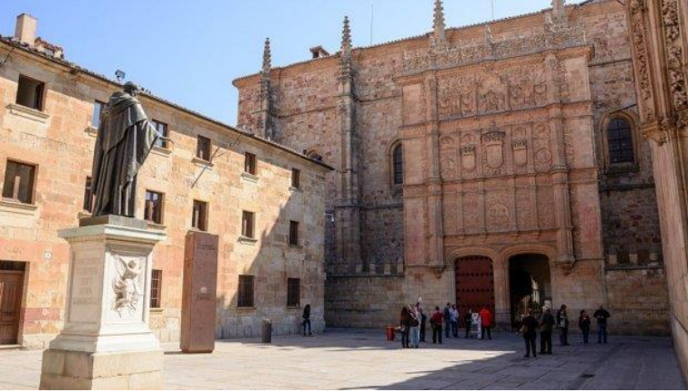
Universidad de Salamanca