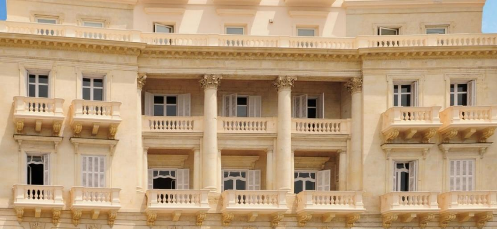
Università degli Studi di Napoli, „L'Orientale“