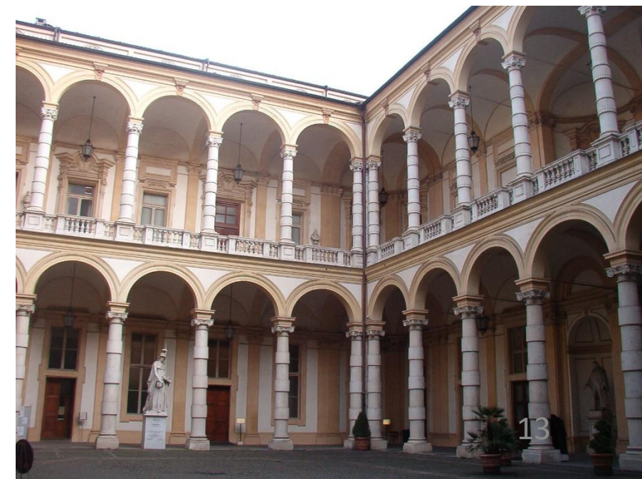
Università degli Studi di Torino