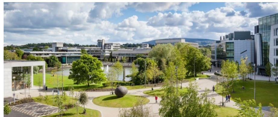
University College Dublin