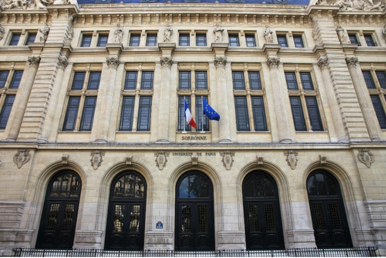
Université Sorbonne Nouvelle Paris III