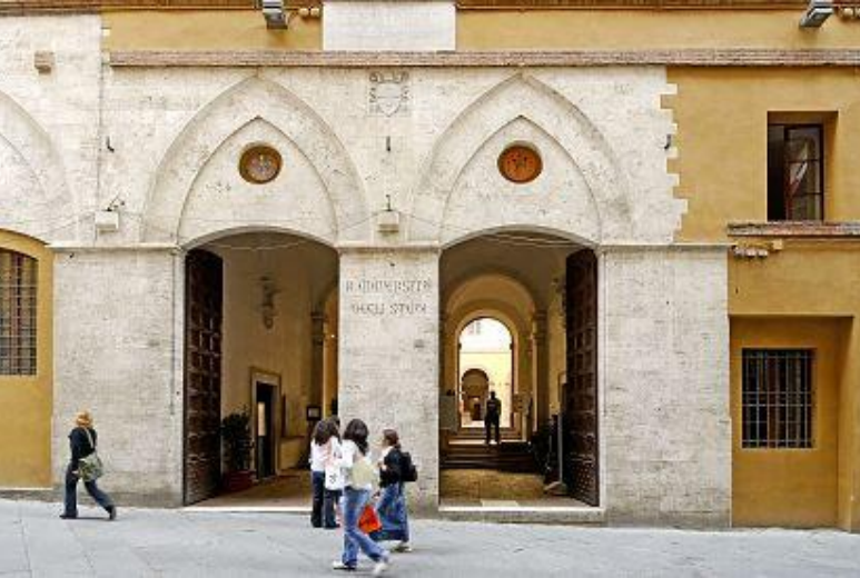
Università degli Studi di Siena