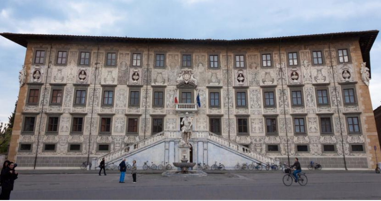
Università di Pisa