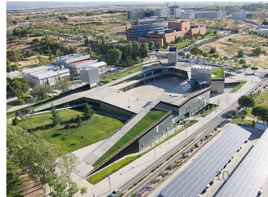
Universidad Autónoma de Madrid