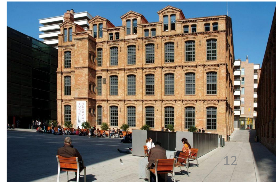
Universitat Pompeu Fabra, Barcelona