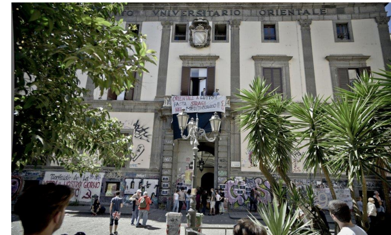
Università degli Studi di Napoli, „L'Orientale“