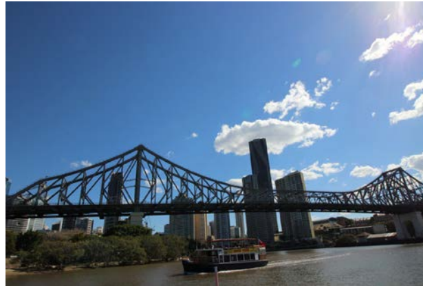
Brisbane, Story Bridge